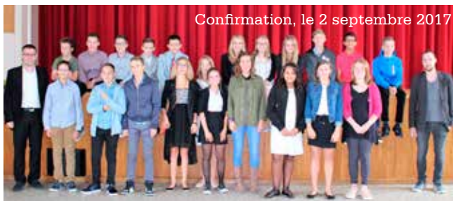
Confirmation, le 2 septembre 2017