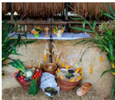
Messe des paysans au Maira le 10 septembre