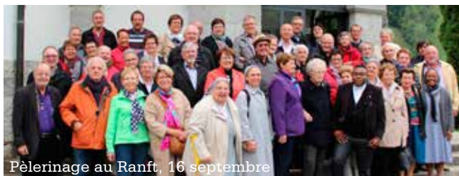
Pèlerinage au Ranft, 16 septembre