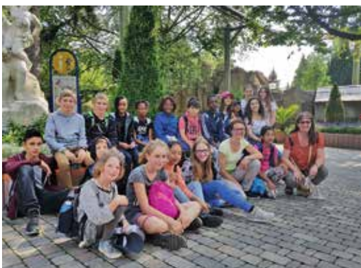
Samedi 9 juin, les mines réjouies des servants de messe du Vallon et des enfants du Chœur Alegria en sortie à Europa Park