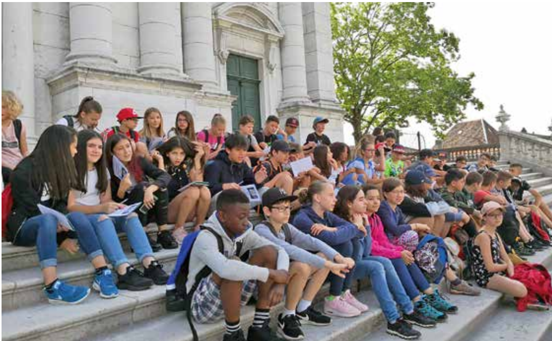
Les confirmands devant la cathédrale Saint-Urs et Saint-Victor, à Soleure