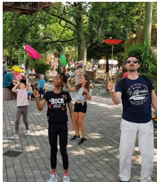
Jonglage gyroskopique avec une assiette chinoise !