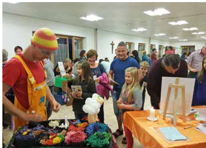
Forum pastoral à Boécourt 2017

Sortie : samedi 15 septembre Préparation forums : mardi 18 septembre, 20h, complexe paroissial, Bassecourt