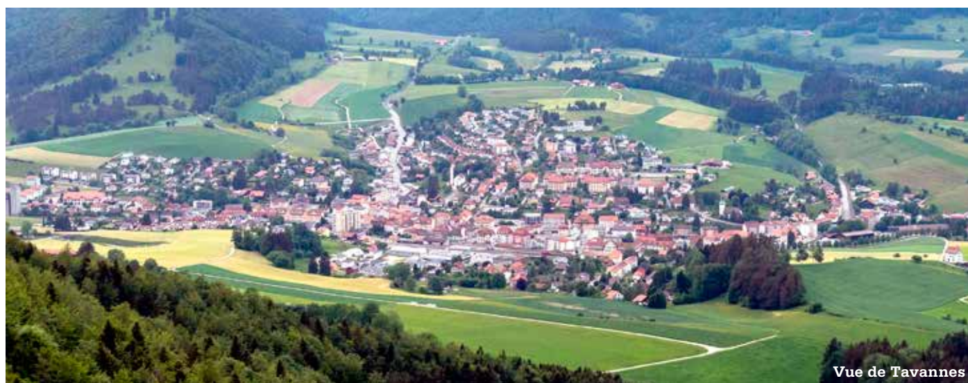
Vue de Tavannes