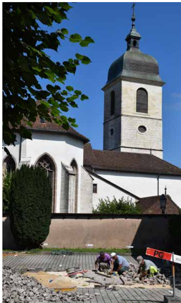
Chantier important en vue pour les paroisses d'Ajoie

Si, selon la volonté de notre évêque, cinq nouvelles paroisses canoniques pourraient donc voir le jour assez rapidement chez nous, cela ne présume pas de l'évolution du nombre de communes ecclésiastiques dans notre région. L'organisation de l'Eglise dans notre pays distingue, en effet, la direction pastorale, confiée par l'évêque aux agents pastoraux qui reçoivent une mission canonique, de la gestion financière et administrative, portée par les autorités élues en assemblées. Certaines communes ecclésiastiques ont déjà fusionné. Des processus sont en cours ou en réflexion. La décision sur l'organisation administrative dépend du choix démocratique des paroissiens. Celle-ci peut être différente du découpage pastoral souhaité par