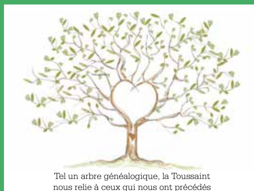
Tel un arbre généalogique, la Toussaint nous relie à ceux qui nous ont précédés

Cette importance de la généalogie se révèle aussi dans la vie et la mission de Jésus. Saint Mathieu démontre bien cet enracinement historique du Verbe fait chair. Nos parents