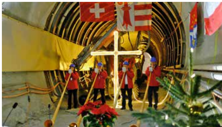
Messe dans le laboratoire du Mont-Terri à l'occasion de la Sainte Barbe le 3 décembre 2018

Troisième célébration annuelle durant le carême avec les mennonites et les protestants.