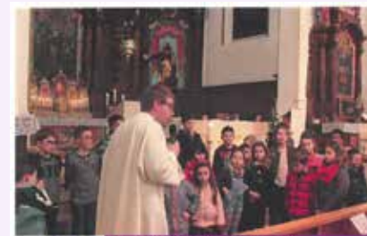
PROPOSITIONS FAMILLES AJOIE - CLOS DU DOUBS