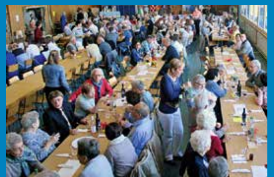
Journée missionnaire à Buix en 2017

Le mois d'octobre de cette année a été proclamé par le pape François mois missionnaire extraordinaire (lire pp. 3-4). Il sera placé sous le thème « Baptisés et envoyés... ». Chaque baptisé est appelé à y participer. C'est dans cet esprit que le Jura pastoral organise une célébration pour la mission le 19 octobre en l'église de Courtedoux à 18h. Tous les chrétiens du Jura pastoral y sont invités ! Ce samedi-là, il n'y aura pas d'autres messes dans nos UP. Toutefois, nous aurons notre célébration le 20 octobre dans l'église de Courtemaîche. Elle sera suivie d'un apéritif et d'un repas servis à la Halle polyvalente de Courtemaîche dans la bonne humeur et la convivialité. Grâce à vous tous, nous soutiendrons quelques œuvres dont