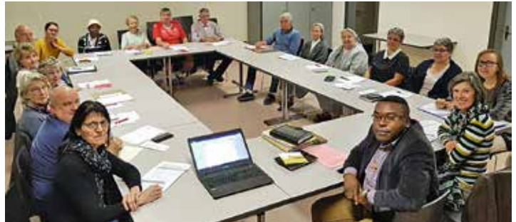
Le Conseil pastoral de l'Eau Vive en réflexion sur l'avenir de la pastorale dans l'UP