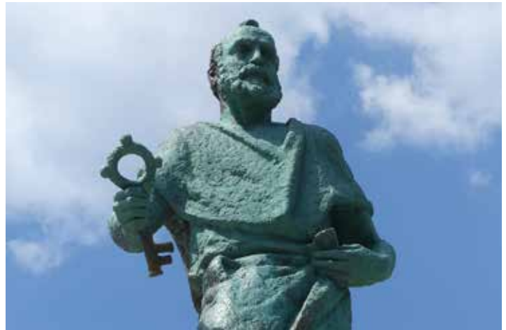
Saint-Pierre sera-t-il le saint patron de la paroisse nouvelle ?

Indépendamment de la demande de notre évêque, les trois com-