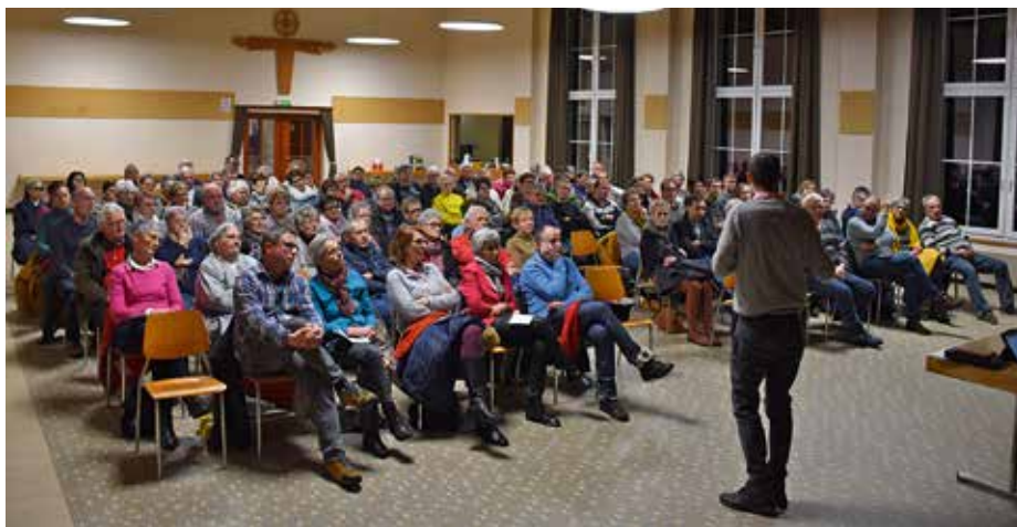
Assemblée des paroissiens dans l'Eau Vive, le 28 janvier dernier, pour choisir le nom de la nouvelle paroisse et son saint patron