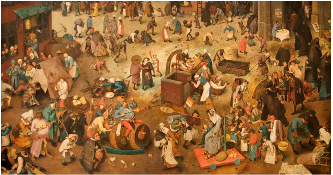
Pieter Bruegel l'Ancien, Le combat de Carnaval et Carême, 1559, Kunsthistorisches Museum de Vienne

« L'homme ne vit pas seulement de pain » Luc, 4-4