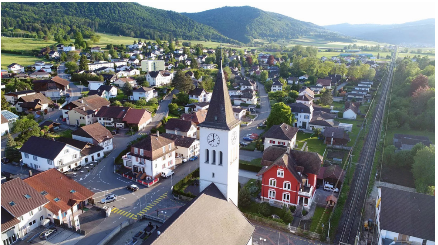
Eglise Saint-Pierre à Bassecourt

9h, Develier Carmel 9h30, Undervelier 11h, Bassecourt