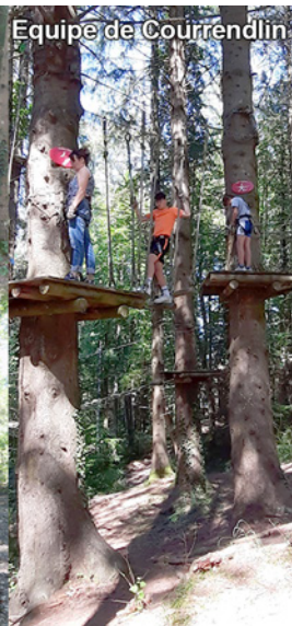
Equipe de Courrendlin