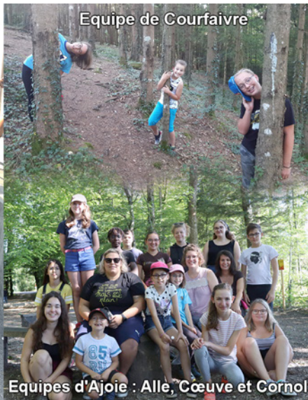
Equipe de Courfaivre