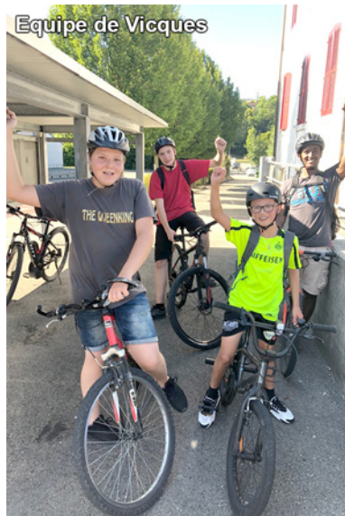
Equipe de Vicques