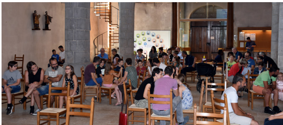
Dimanche avec Dieu, une nouvelle proposition familiale « corona-compatible » (lire en p. 8)

Coronavirus et renouvellement des parcours conduiront à des manières différentes de vivre la catéchèse.