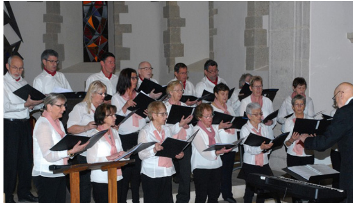
Comme d'autres sociétés, la chorale de Chevenez honorera plusieurs de ses membres.

Chaque mot prononcé est déjà un son, une musique. Mais le chant, en ajoutant une mélodie aux mots, élargit, souligne, approfondit leur sens. Le chant en dit plus que le texte seul, mais sans tout dire non plus. Les personnes qui ont écrit et rassemblé les textes de la bible ont reconnu l'importance particulière du chant: ils ont consacré un livre entier aux psaumes, ces prières chantées. Comme pour bien montrer que le chant constitue une respiration dans la vie de foi, d'autres chants sont aussi disséminés dans les deux testaments. Il n'est donc pas étonnant que l'absence de nos chorales de mars à la rentrée ait souvent été éprou-