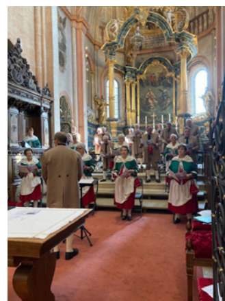
Messe en patois à St-Ursanne