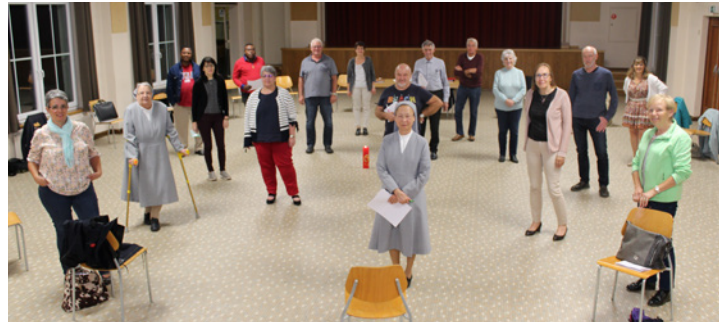
Conseil pastoral de l'Eau Vive

Comme l'année passée, le thème pastoral est : « Suivre ». « Suis-moi », c'est l'appel du Seigneur à chacun. Il se renouvelle pour nous avec des accents différents aujourd'hui.