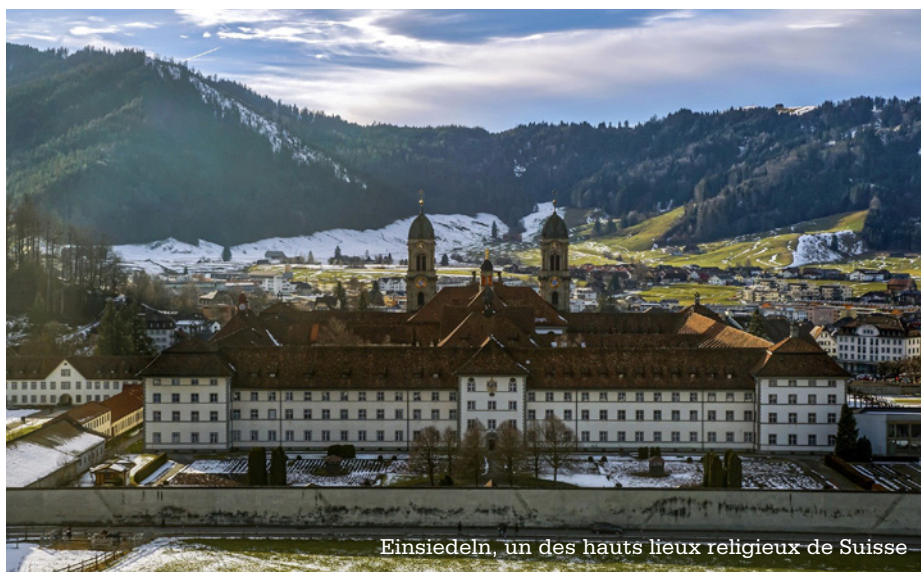
Einsiedeln, un des hauts lieux religieux de Suisse