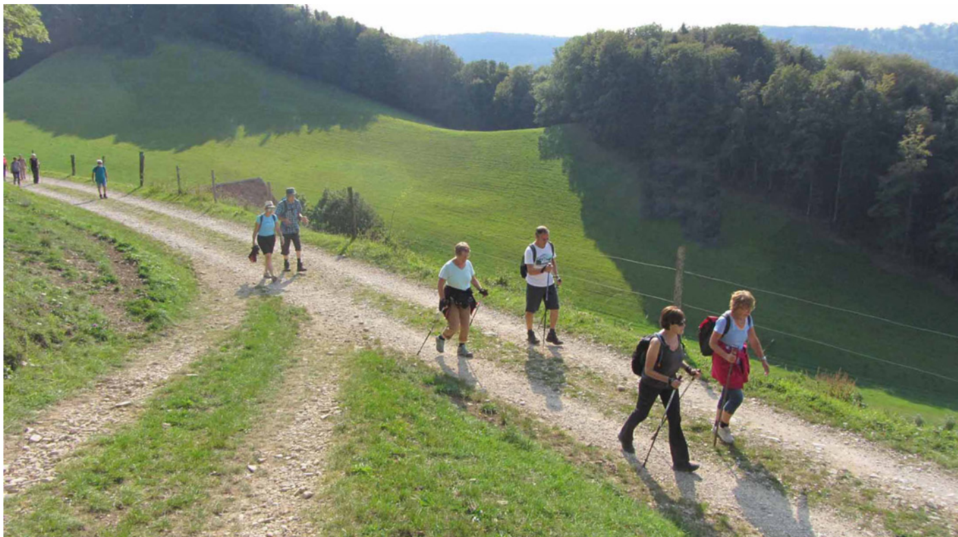
Marche sur les pas de saint Ursanne, un exemple d'une nouvelle pastorale

Avec les mesures sanitaires à respecter, c'est une nouvelle pastorale qui voit peu à peu le jour. Tour d'horizon des propositions pour vivre la foi dans le respect des distances physiques.