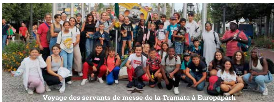
Voyage des servants de messe de la Tramata à Europapark

Dans notre paroisse cette fête sera organisée de la manière suivante: le matin la messe sera animée par la chorale et par le petit chœur d'enfants dirigé par Sœur Benjamina.