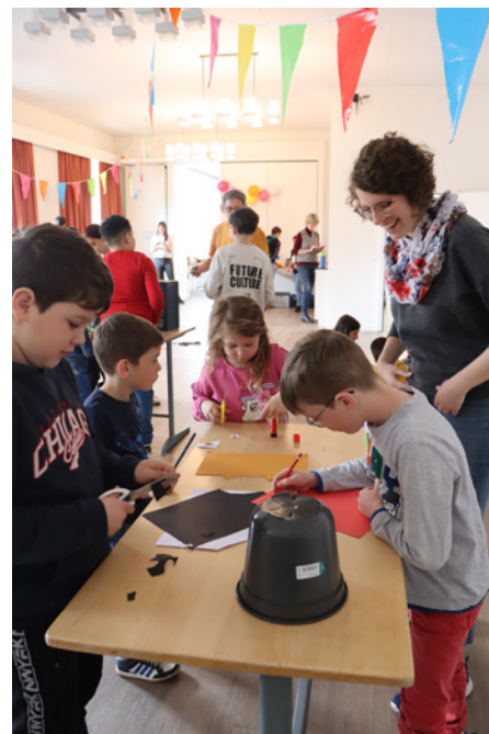
Equipe de Grandfontaine lors de la Fête du Jeu à Tramelan