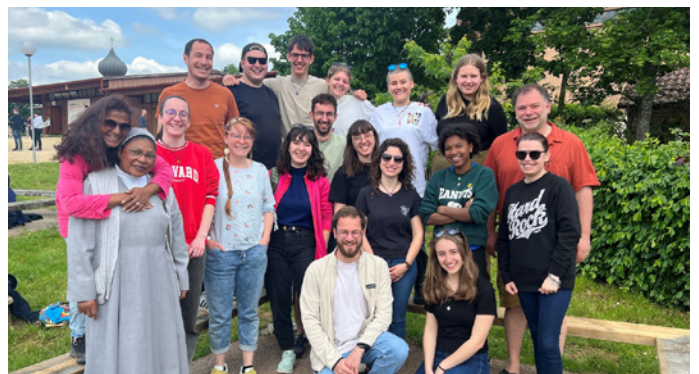
Les jeunes du Madep et du Service d'Aumônerie Oecuménique des Ecoles (SAOE) ont vécu une retraite mémorable à Taizé.