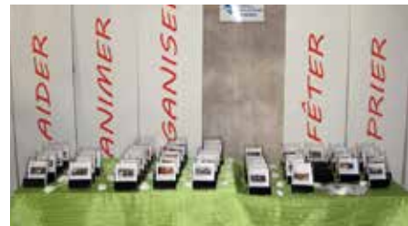
Les papillons présentant les activités de l'UP sont disponibles à St-Pierre

Des coups de main ponctuels seraient aussi les bienvenus pour l'organisation des temps commu-