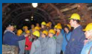
Echos du voyage en Belgique (servants et Arc-en-Sources) www.upsources.ch/belgique