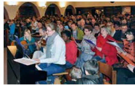
Temps communautaire de l'avent 2013

Nous comptons également sur chacune et chacun d'entre vous qui avez un rôle important à