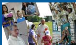
Photos des activités pastorales de l'année écoulée www.upsources.ch/galerie2014