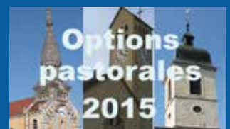
Options pastorales mises en œuvre en 2015 www.upsources.ch/options2015