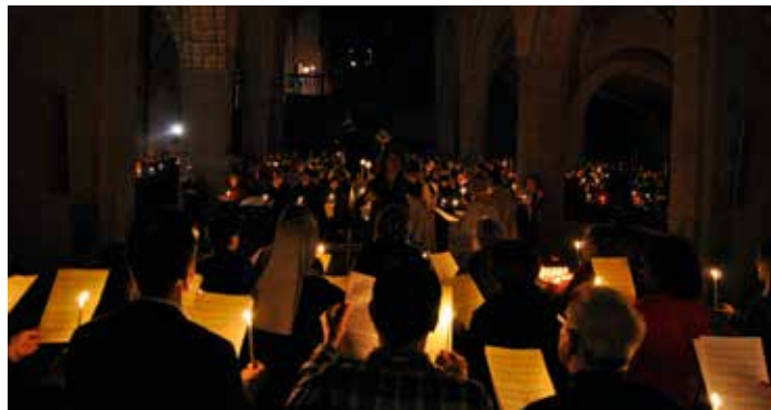
Noël nous ouvre un nouveau passage vers Dieu. Ici: Noël 2013, à St-Pierre

Certains le croient encore dans les nuages! Depuis le premier Noël, Jésus nous a pourtant donné l'image d'un Dieu qui nous rejoint dans notre humanité: il est passé par Nazareth; par son Esprit, il continue, aujourd'hui encore, de nous rejoindre dans notre quotidien. Grâce aux propositions du Service du cheminement de la foi, nous vivrons ces prochains mois au rythme des passages: passage à une nouvelle année liturgique (avent) puis civile (Nouvel An), passage au printemps, passage de la mort (à Pâques et encore à la Toussaint). Pour chacun d'eux, un temps communautaire nous donnera d'expérimenter ce Dieu qui passe dans nos vies et nous invite, sans cesse, à dépasser nos impasses.