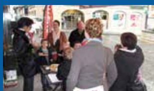
Photos du temps communautaire du 25 octobre 2014 www.upsources.ch/25octobre