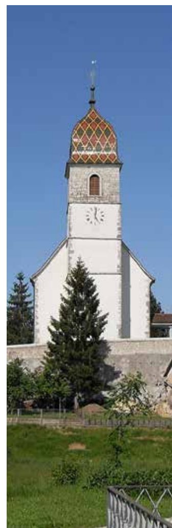
Eglise de Bonfol

9h, Porrentruy, St-Germain (italien) 9h30, Buix 10h, Alle 10h, Chevenez 10h, Porrentruy, St-Pierre 10h, Saint-Ursanne 11h, Montignez 11h, Porrentruy, St-Germain (portugais et espagnol) 18h, Porrentruy, St-Germain