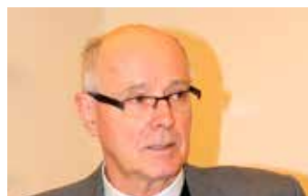
Mgr Gérard Daucourt

Comme chaque 10 janvier, l'église de Soyhières était pleine de monde pour la fête de la sainte