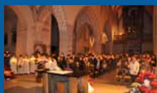
Photos de la messe de minuit à Saint-Pierre www.upsources.ch/noel2014