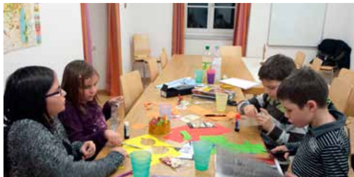
MADEP équipe Cornol

Actuellement, ce sont environ une centaine d'enfants, répartis dans 15 équipes et accompagnés par 25 accompagnateurs, qui se réunissent tous les 15 jours dans divers lieux du Jura pastoral.