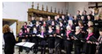
La Sainte-Cécile de Porrentruy lors d'une messe TV en 2014.

Le chœur Sainte-Cécile de Porrentruy se produira en concert, en collaboration avec d'autres chorales, une suisse et deux françaises : « Fusion 2013 », « Belfonie », « Chorale Union Delloise », sous la direction de Myroslawa Antonowycz, le dimanche 22 mars 2015, à 17h à l'église Saint-Pierre à Porrentruy et le vendredi 1 er mai, à 20h, à l'église Saint-Léger à Delle. Le programme est centré autour de