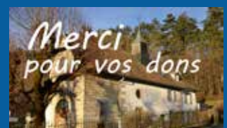
Restauration chapelle de Lorette IBAN CH28 0630 0042 3022 4010 2 www.upsources.ch/restauration-lorette