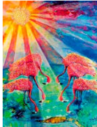
«Les flamants roses s'inclinent devant les pieds de Jésus» par une artiste bahamienne pour la JMP 2015.

La liturgie de cette année a été préparée par des femmes des Bahamas à partir d'un texte de l'évangile de Jean: «Comprenez-vous ce que j'ai fait pour vous?» (Jean 13,12). C'est la question que Jésus pose à ses disciples après leur avoir lavé les pieds, geste ayant suscité en eux stupéfaction et trouble. La réponse des Bahamiennes, qui traverse toute la liturgie comme un fil rouge, est celle de «l'amour radical», qui rend