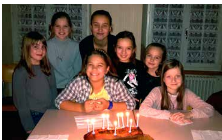
MADEP équipe de Alle (VAB)

Ces rencontres permettent aux enfants et aux adolescents de découvrir que par la réflexion, l'action, l'expression de leur vie et de leur foi, ils sont capables, eux-mêmes et avec d'autres d'évoluer et de transformer des situations dans leurs milieux de vie. Les enfants et les adolescents témoignent ainsi de Jésus-Christ présent aujourd'hui.