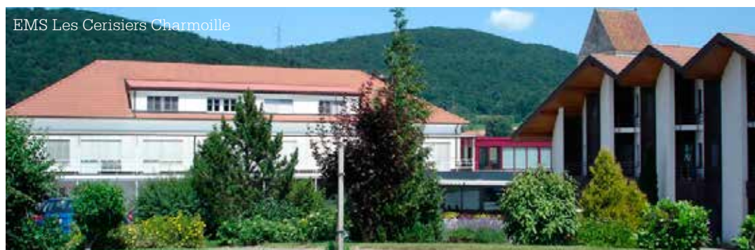
EMS Les Cerisiers Charmoille

Ce poste est un complément aux services rendus par l'abbé Pierre-Louis Wermeille, qui assume essentiellement la célébration des sacrements (messe, sacrement des malades, confessions) dans l'ensemble des EMS du canton du Jura, en collaboration avec l'abbé Jean-Marie Rais (pour le home Claire-Fontaine de Bassecourt et la résidence Les Pins de Vicques).