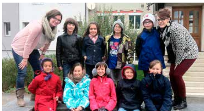
MADEP équipe de Malleray (Tramata)