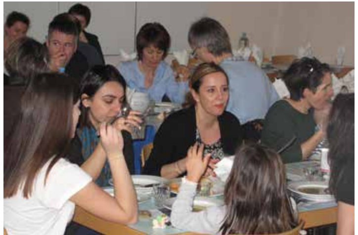
Les soupes de carême : une belle occasion pour vivre le partage.

Depuis le mercredi des cendres (18 février) à Pâques (5 avril), chaque semaine nous progresserons, au rythme des rassemblements de chaque dimanche, des soupes, spaghettis ou roses de carême (dates p. 18), des réflexions quotidiennes du calendrier de carême, disponible aux entrées des églises