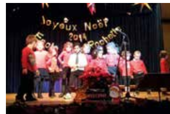
Spectacle de Noël de l'école des sœurs à Tavannes

Retrouvez d'autres photos sur nos sites internet: www.cathberne.ch