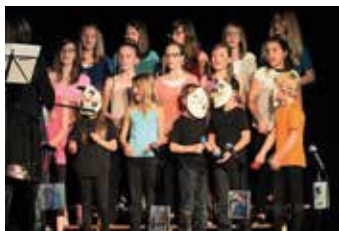
Concert du groupe Shalom à Malleray