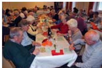
Noël des aînés à Tramelan (cette fête a également eu lieu à Malleray et Tavannes)