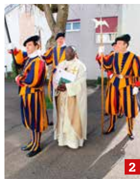
2 Le 18 avril à Tramelan, assemblée générale des anciens gardes suisses du Pape.