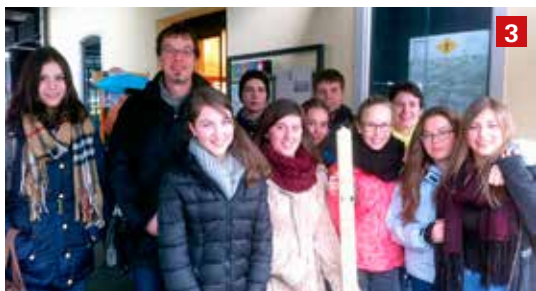
3 Trois jeunes de la Montée vers Pâques de la Vallée de Delémont ont décoré un cierge pascal pour l'offrir aux catéchumènes de la paroisse réformée de Delémont.