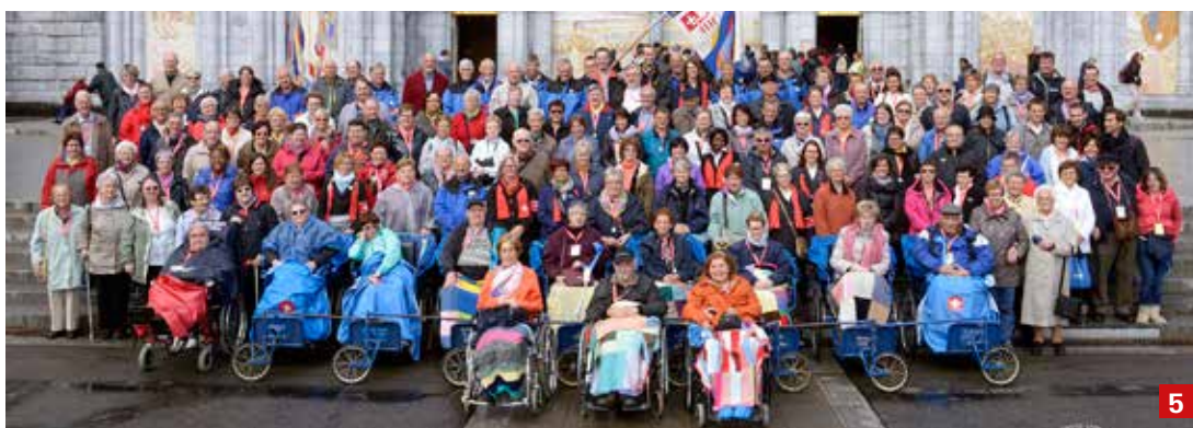
5 Une partie des pèlerins et des hospitaliers jurasiens lors du pèlerinage à Lourdes du 17 au 23 mai. Photo en grand format sur www.jurapastoral.ch/lourdes2015