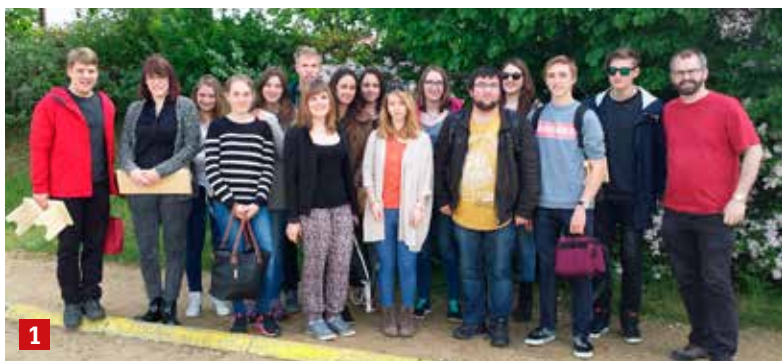
1 Le groupe Envol en week-end à Taizé les 2 et 3 mai derniers