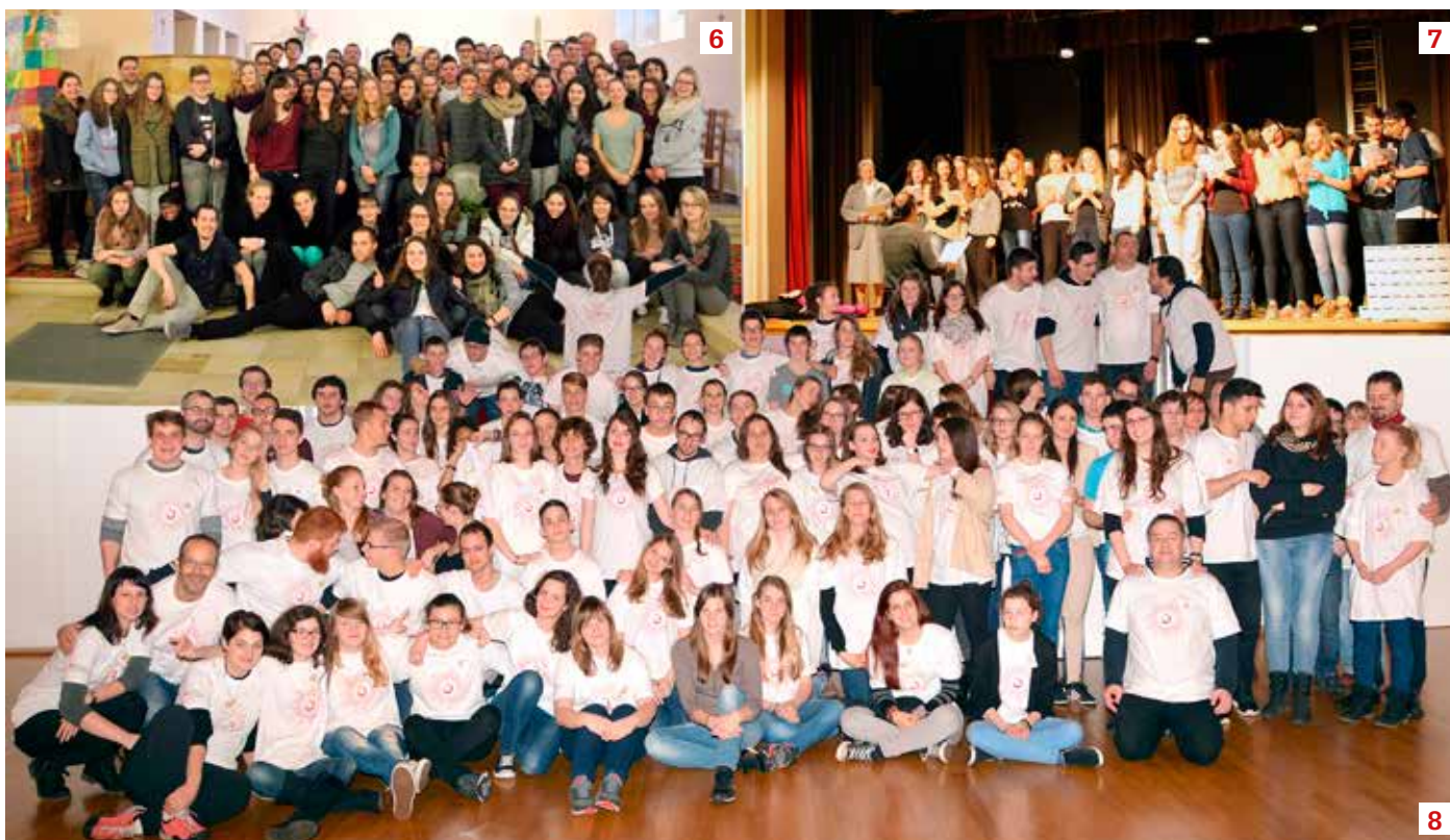
6 , 7 et 8 Les participants aux Montées vers Pâques de la Vallée de Delémont (6), de l'Ajoie et du Clos du Doubs (7) du Jura bernois et des Franches-Montagnes (8).