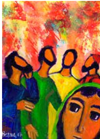
Aujourd'hui, comme à la Pentecôte, l'Esprit est donné à tous pour le bien de toute la communauté.

Cette année, nous allons vous informer régulièrement et vous inviter à prendre une part plus active à votre vocation de baptisé. Et si vous n'avez pas d'idée, le secrétariat, les membres de l'Equipe pastorale ou moi-même sommes à votre service pour vous soutenir dans cette démarche. L'engagement peut être proportionnel à vos disponibilités... et pour certains qui soutiennent n'avoir pas le temps, il s'agira sans doute de faire un petit examen de conscience pour voir que l'on a toujours du temps pour ce que l'on aime... alors souhaitons