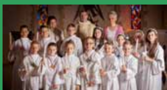
Première communion Chevenez www.uphauteajoie.ch