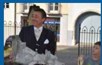
Photos du circuit secret des églises de Porrentruy upsources.ch/circuit-secret