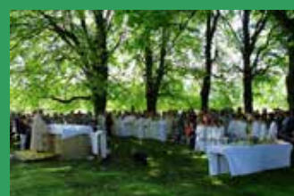
Fête-Dieu à Réclère www.uphauteajoie.ch