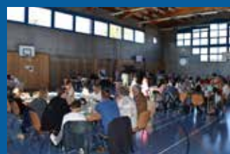
Photos du temps communautaire de la Fête-Dieu upsources.ch/fete-dieu2016