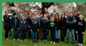
Confirmation Courtedoux www.uphauteajoie.ch