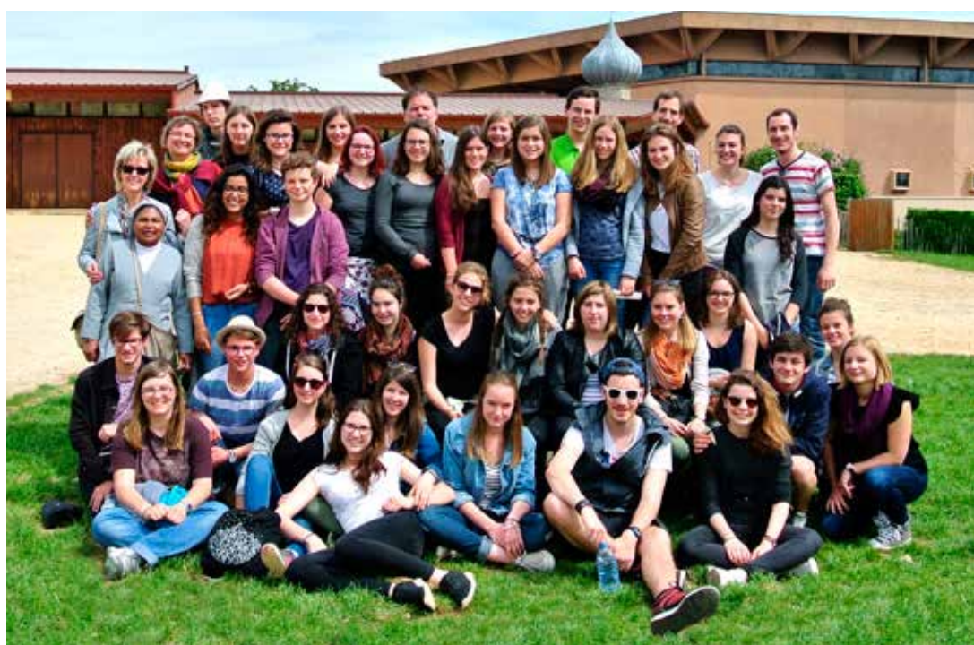
Une quarantaine de jeunes du Jura pastoral ont vécu quatre jours à Taizé pour l'Ascension, au rythme de la communauté de Taizé, avec 3500 autres personnes. D'autres photos sur www.sepaje.ch/taize2016