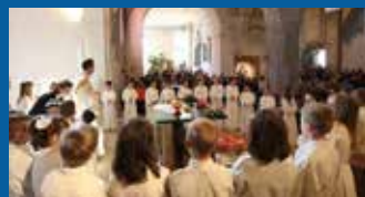
Photos et noms des premiers communiant (commande possible en ligne) upsources.ch/communion2016